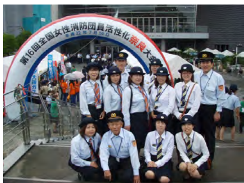
第16回全国女性消防団員活性化奈良大会

また、佐賀県内で開催される女性活性化セミナーや全国で開催される女性消防団員活性化大会に参加することで、他の女性消防団員と地域を越えた情報交換を行い、日々消防団員としての技術や知識の向上に努めています。