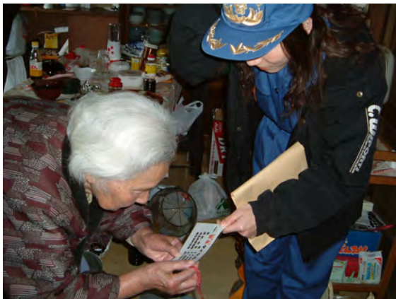
一人暮らし老人宅の防火予防査察

特に印象に残る活動としては、平成18年11月に東与賀町総合防災訓練の避難訓練、地震体験訓練、消火器取扱訓練、煙体験訓練、救命救急講習訓練、災害救助訓練に参加しました。特に女性部として炊き出し訓練、非常食配給を婦人会と合同で日赤佐賀県支部の指導により実施しました。