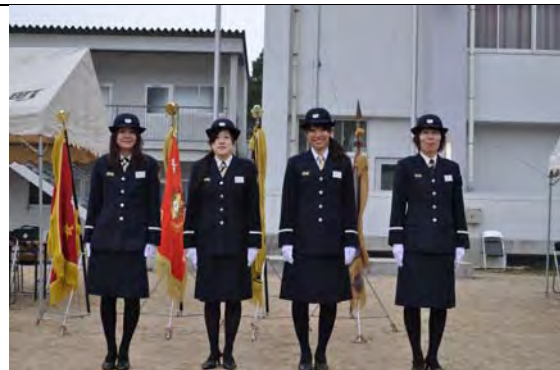
瓦落し競技大会 開会前に