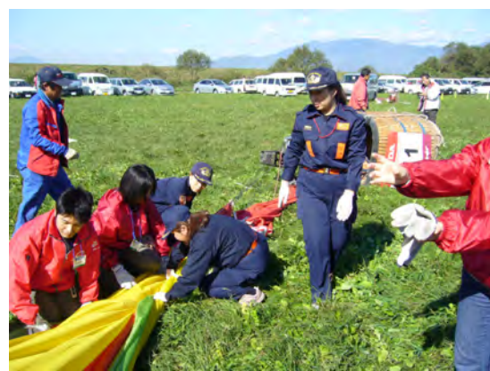
佐賀インターナショナルバルーンフェスタ (ボランティア参加)