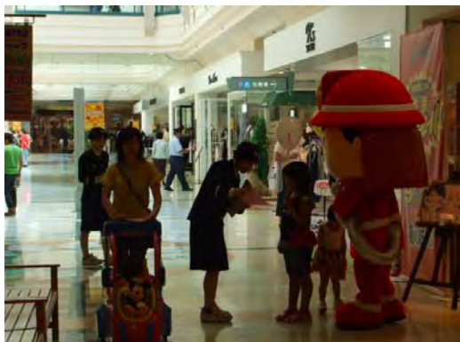
救急フェスティバル