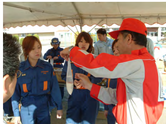
総合防災訓練での炊き出し訓練