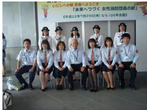
第16回全国女性消防団員活性化奈良大会