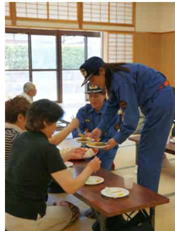
多久市防災訓練 (H22年6月6日)