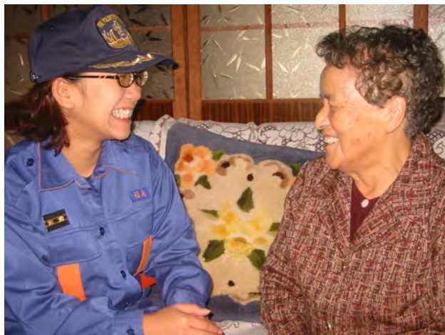
高齢者宅防火指導訪問 (H22年11月22日～26日)