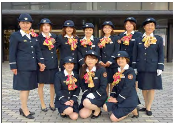
第21回 全国女性消防団員活性化佐賀大会にて