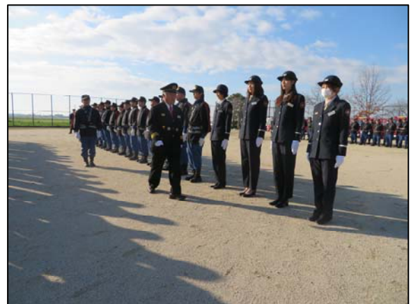
出初式での通常点検の様子