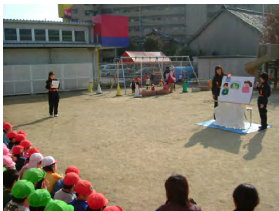
幼稚園での防火パネルシアター