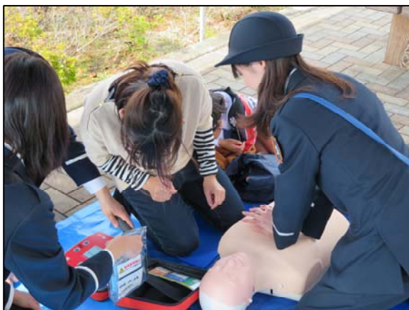
防火パレードでAEDの使用方の説明

全国的に災害が多く発生しているなか、地域に貢献できるように様々な取り組みを行っていきたいと考えています。